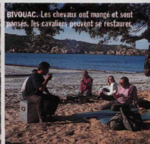
BIVOUAC. Les chevaux ont mangé et sont pansés, les cavaliers peuvent se restaurer.