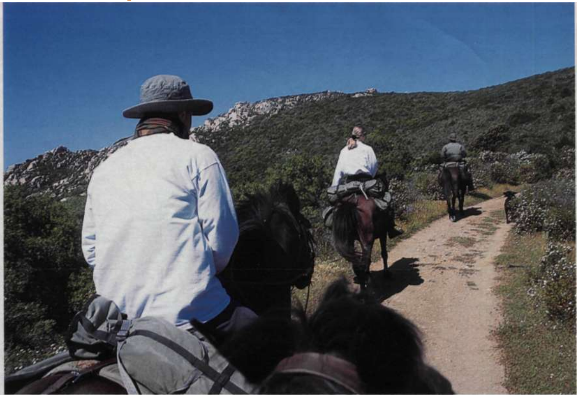
A LA FRAICHE. Le périple continue vers la montagne de Cagna.

• ficultés du terrain et d'une endurance qui force le respect. En une semaine, la jument Alba, le vieux mais infatigable Libej et leurs quatre compères ont franchi les épreuves sans barguigner. Entre autres, une impressionnante zone de sables mou-