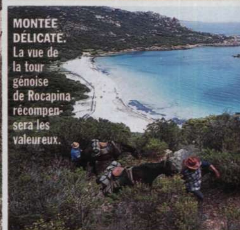
MONTÉE DÉLICATE. La vue de la tour génoise de Rocapina récompensera les valeureux.