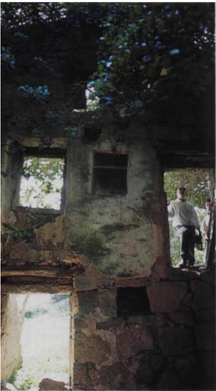
HALTE OMBRAGEE. Visite d'un moulin en ruine sur les bords de l'Ortolo.