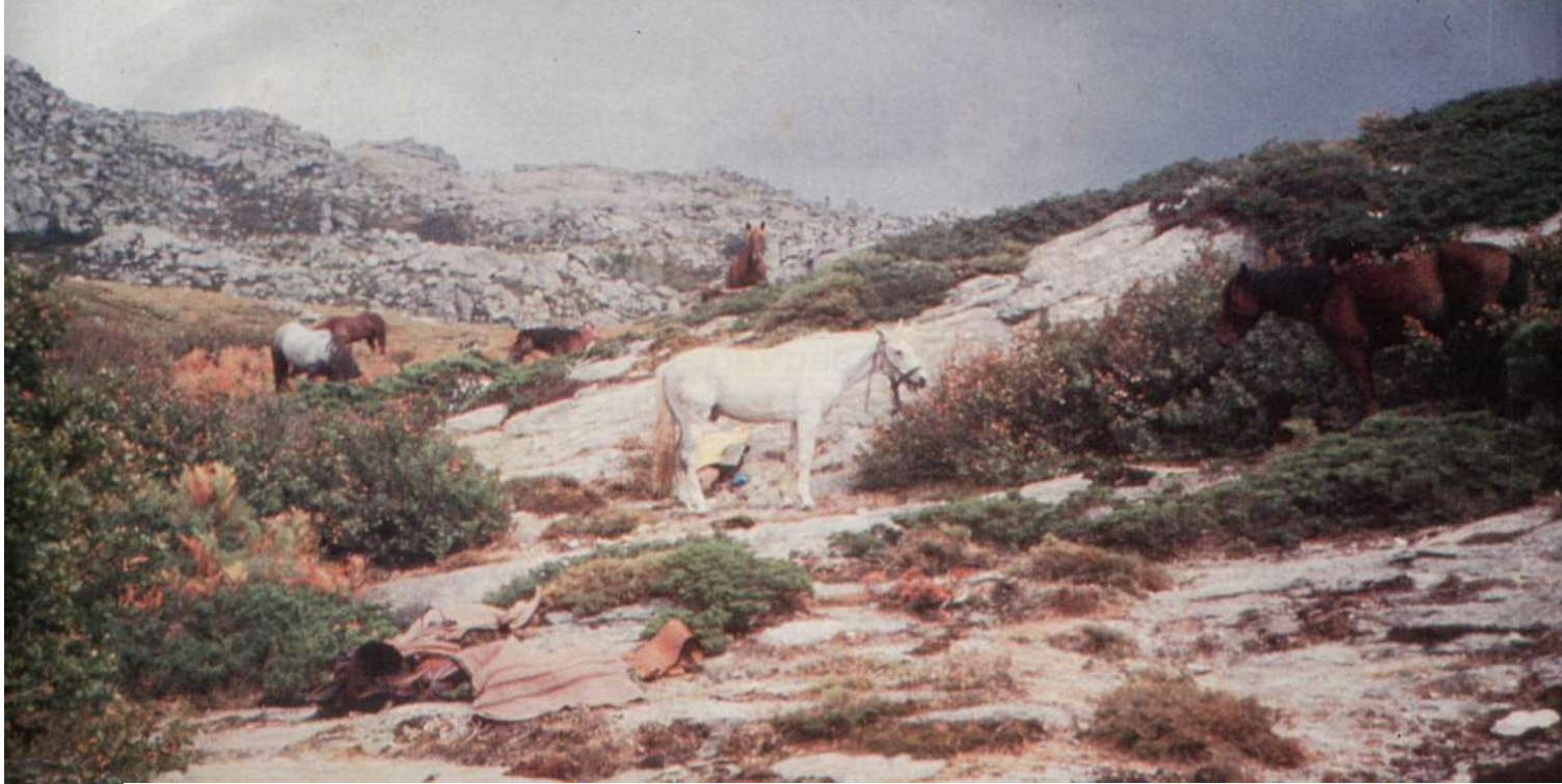
Après une nuit à la belle étoile sur ce plateau de granit, les chevaux profitent des premiers rayons de soleil. Bientôt couvertures et affaires sont ramassées . (Ph. A. Mariage)